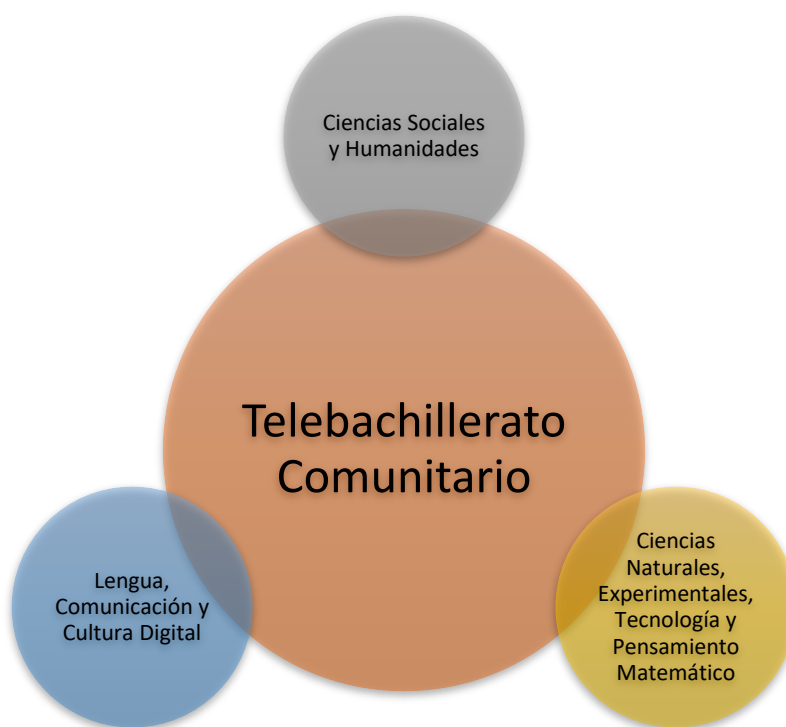
Figura 1. Áreas de conocimiento del TBC