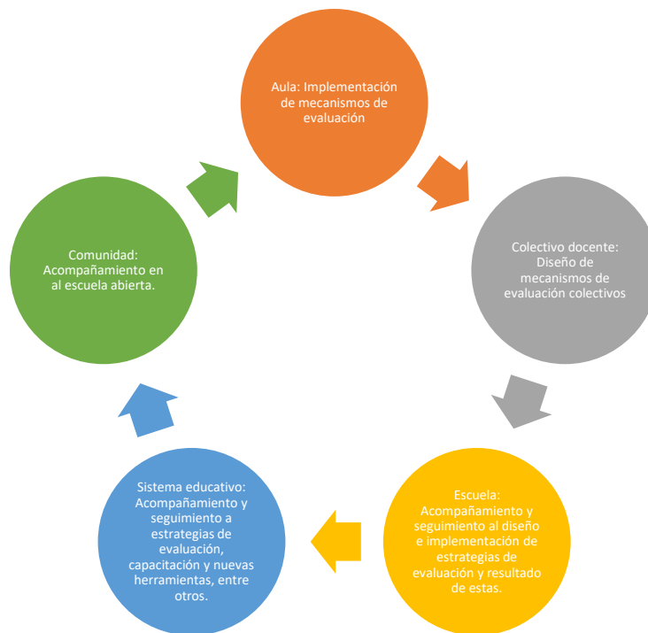
Figura 3. Escenarios de la evaluación