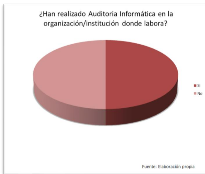
Gráfica 1. ¿Han realizado Auditoría Informática en su organización?

Los encuestados tiene diversas opiniones de la aplicación de una auditoria en informática en organización donde laboran, tales como: