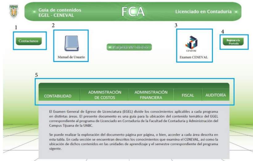
Figura 1. Estructura de la Guía de ubicación de contenidos de CENEVAL